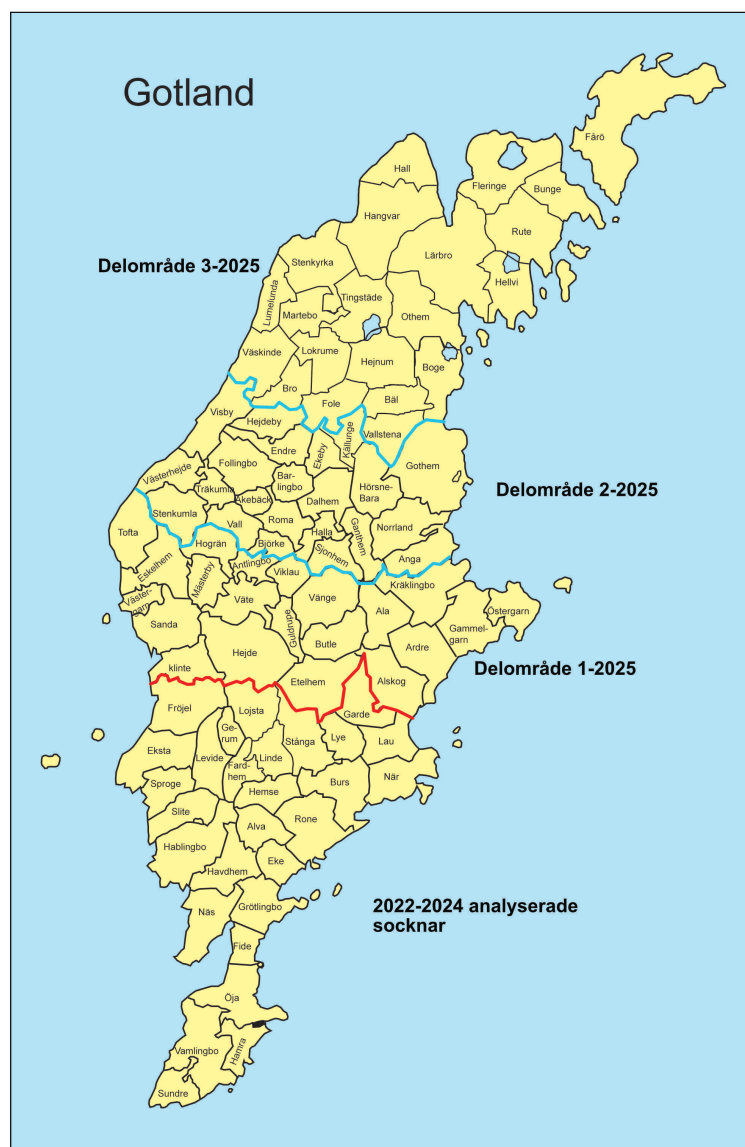
Figur 1. De tre delområden som följts upp innrovarande år

Föreliggande rapport avser således resterande socknar vilka utgör 64 stycken.